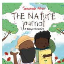
The Nature Journal por Savannah Allen