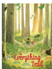
The Everything Trail por Meg Fleming