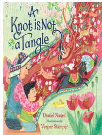
A Knot is Not a Tangle por Daniel Nayeri