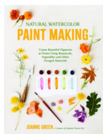
Natural Watercolor Paint Making por Joanne Green