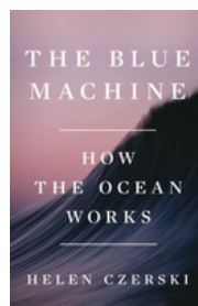
The Blue Machine: How the Ocean Works por Helen Czerski